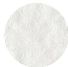
particolare carta interna

Disegno Acquerello. Blocco di alta qualità in cellulosa purissima e 20% di cotone. L'elevata grammatura e la particolare collatura realizzata in massa e con gel vegetali in superficie offrono un'ottima resa all'acquerello.